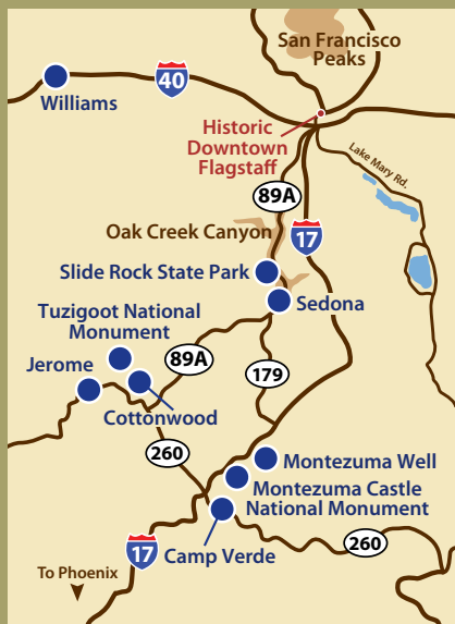
Las distancias desde Flagstaff se originan en el Visitor Center.