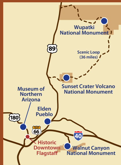
Las distancias desde Flagstaff se originan en el Visitor Center.