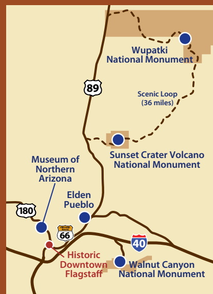
Entfernungsangaben von Flagstaff ab Flagstaff Visitor Center