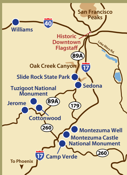
Entfernungsangaben von Flagstaff ab Flagstaff Visitor Center