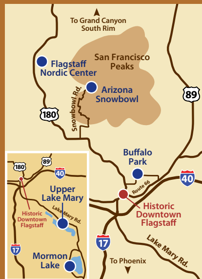
Entfernungsangaben von Flagstaff ab Flagstaff Visitor Center